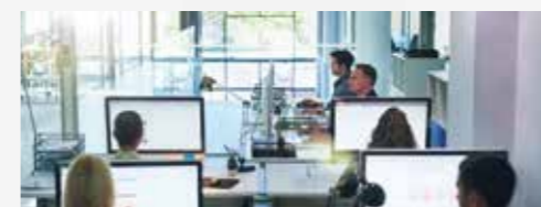
Kleine en middelgrote kantoren, maar ook grote bedrijfsomgevingen