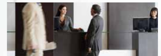
Horeca, inclusief hotels