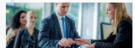
Banken en financiële instellingen